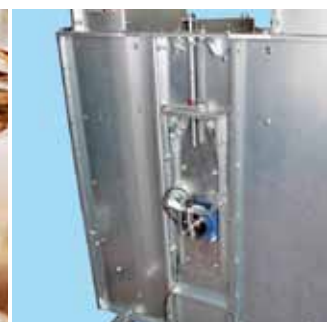
Remspänning i fot & varvtalskvakt.