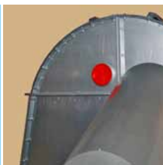
Elevatorkvav med aspirationsanslutning.

GALVANISERAD ENERGISNÅL SERVICEVÄNLIG KOMPAKT DRIFTSSÄKER LÄTTMONTERAD