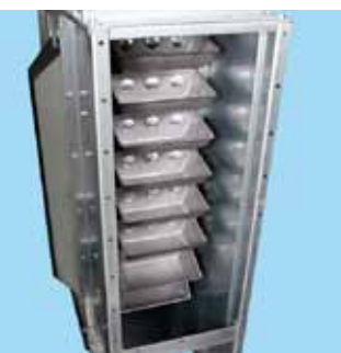
Antistatisk skoprem med stålskopor.