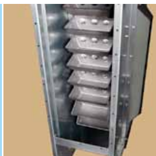
Antistatisk skoprem med stålskopor.

GALVANISERAD ENERGISNÅL SERVICEVÄNLIG KOMPAKT DRIFTSSÄKER LÄTTMONTERAD