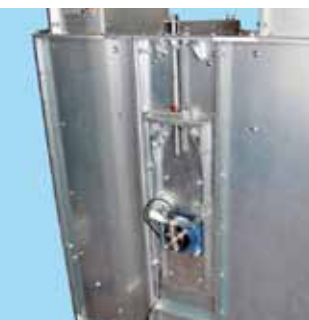
Remspänning i fot & varvtalskvakt.