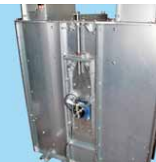
Remspänning i fot & varvtalsvakt.